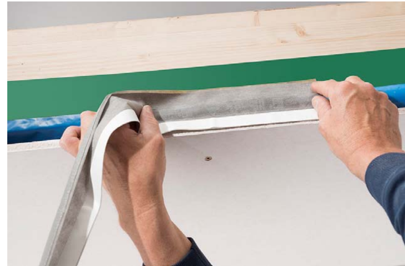
DOLLE Deckenanschlussband umlaufend, deckenbündig verkleben